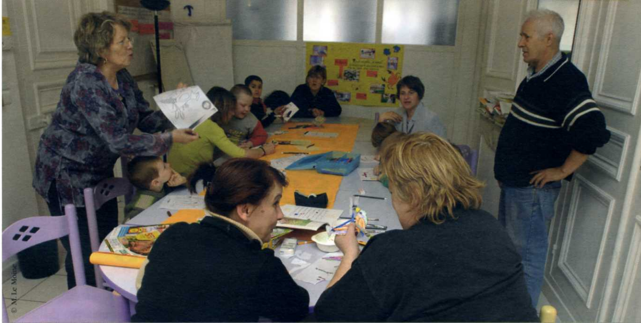
À l'association Reliance de Lille, où l'on apprend le métier de parent...

De plus, nous souhaitons que les anciens contrats « temps libre », qui financent de multiples lieux de loisirs des enfants, ne soient pas réduits à la portion congrue.